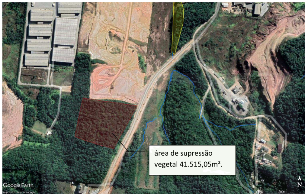
Figura 1: Imagem aérea da área em análise, a ser suprimida.