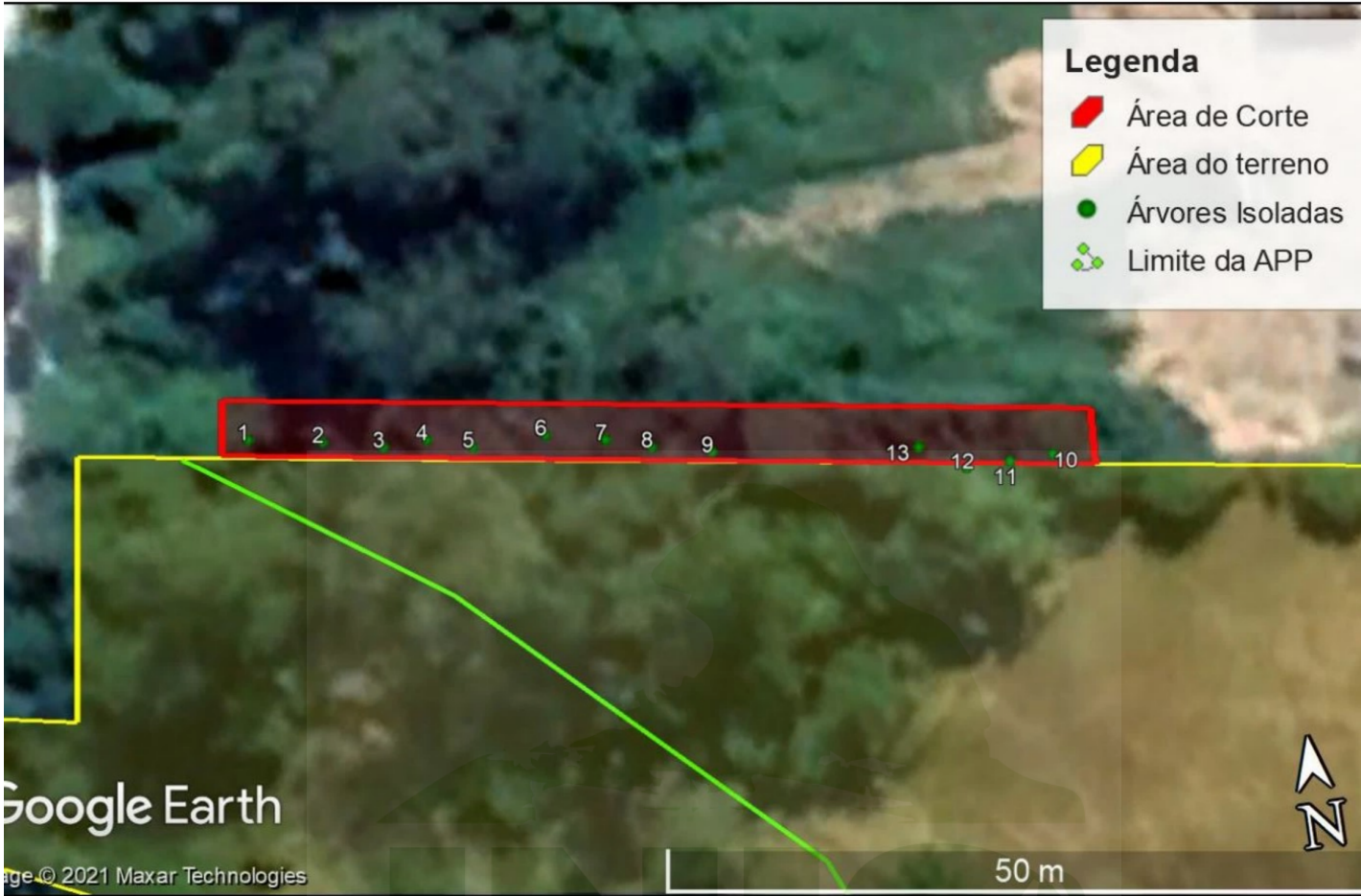
gura 3 – Croqui de localização das espécies.